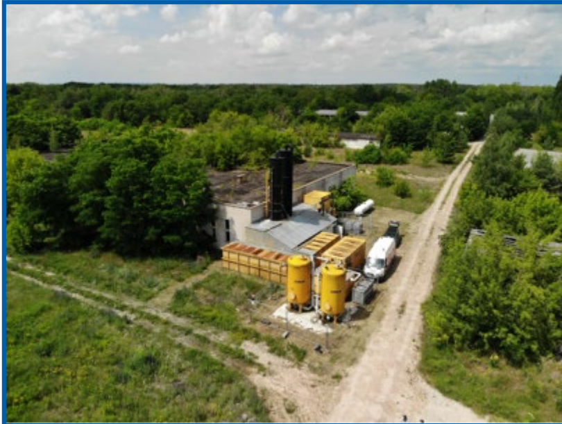
Grundwasserreinigungsanlage in Jüterbog Neues Lager