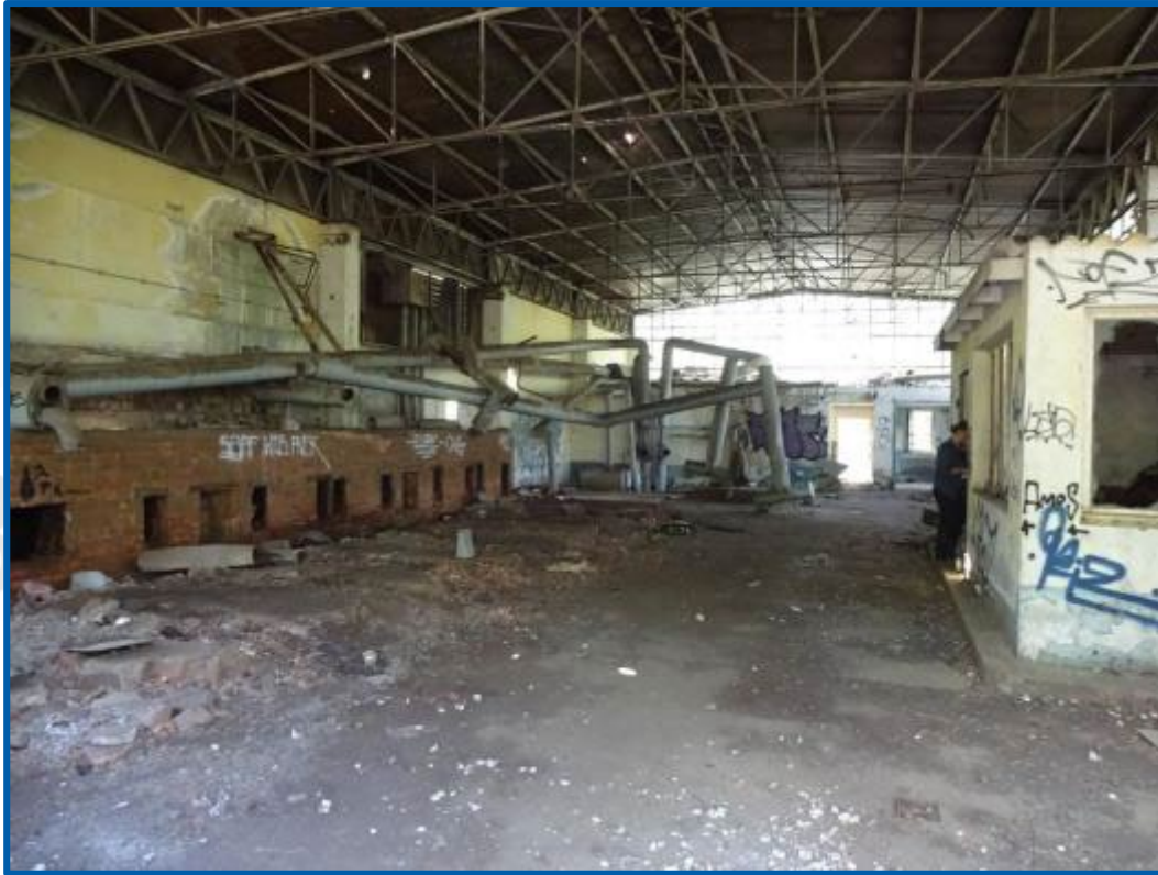
Kaserne Vogelsang - vor dem Abbruch