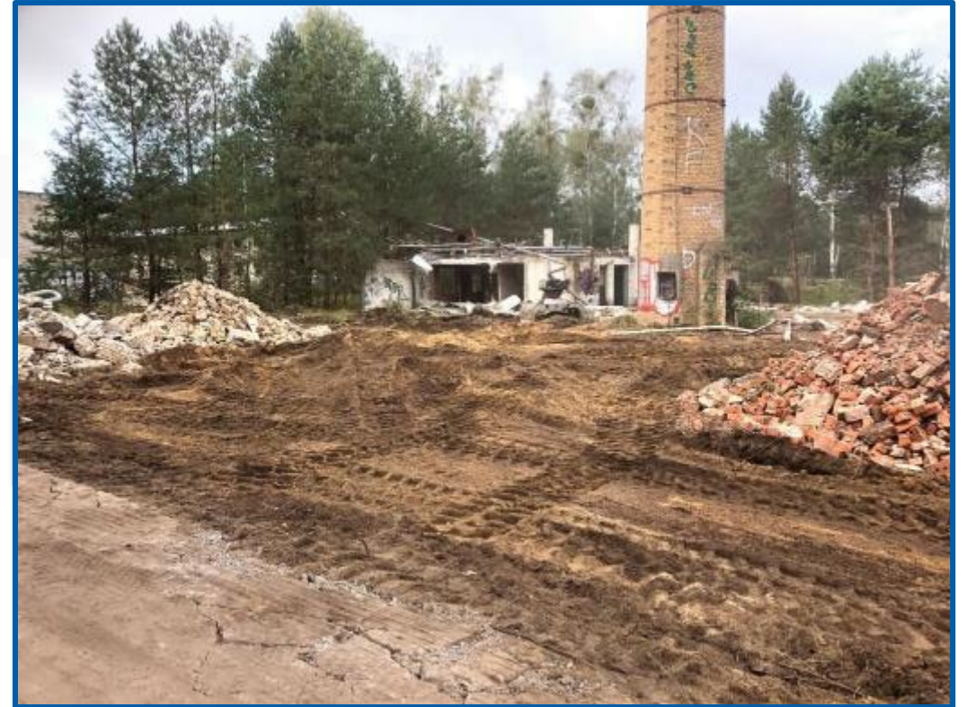
Kaserne Vogelsang - während des Abbruches