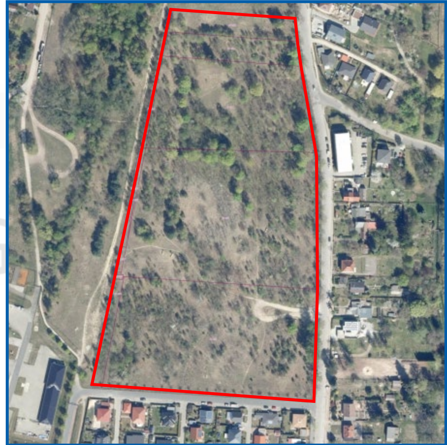
Luftbild mit Kennzeichnung Kaufgegenstand