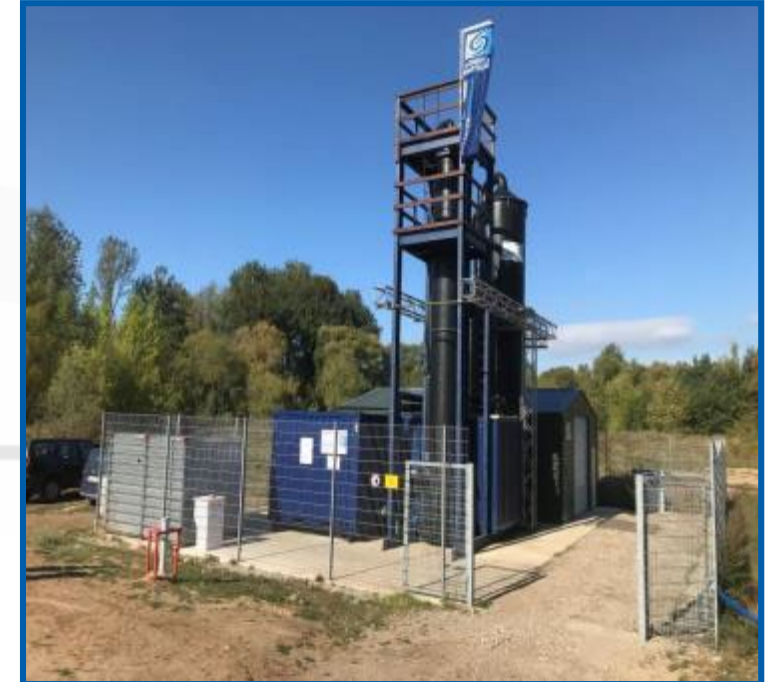
Sanierungsanlage Bernau Schönfelder Weg im neu errichteten Panke-Park