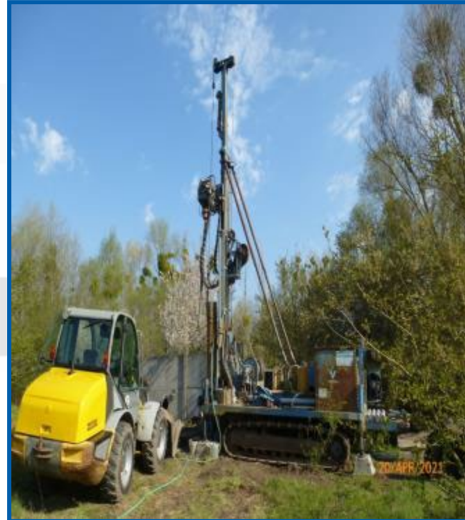
Errichtung der In-situ-biologischen Testfelder zur Beschleunigung der GW-Sanierung in der Kaserne Krampnitz