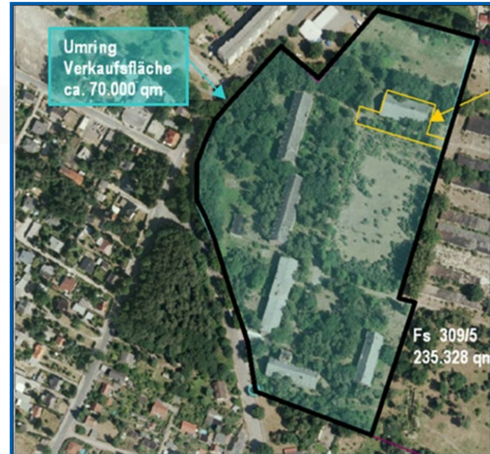
Luftbild mit Kennzeichnung Kaufgegenstand