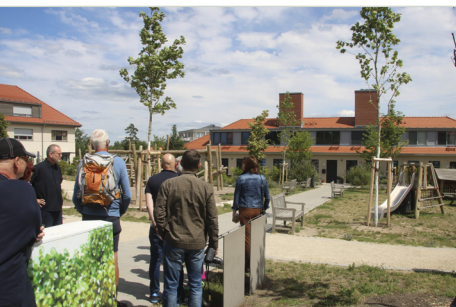
Führung durch das Olympische Dorf Elstal, 2025