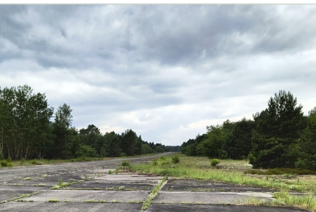
Start- und Landebahn in Sperenberg, 2024