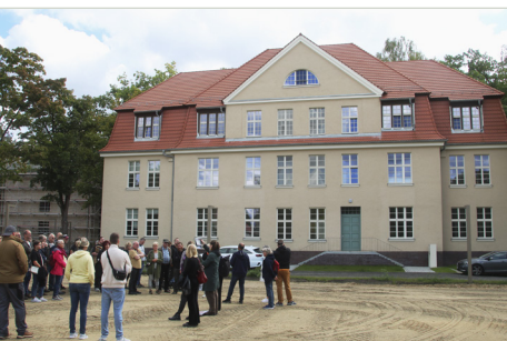
Führung durch das INFA Quartier Wünsdorf, 2025